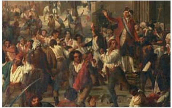
Jules Varnier, Rodolphe d'Aymard et la garde nationale d'Orange arrêtant les massacres d'Avignon, le 11 juin 1790, huile sur toile, 1845