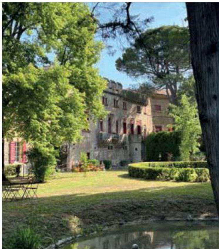
Le château de Thézan, à Saint-Didier, est labellisé Patrimoine en Vaucluse.