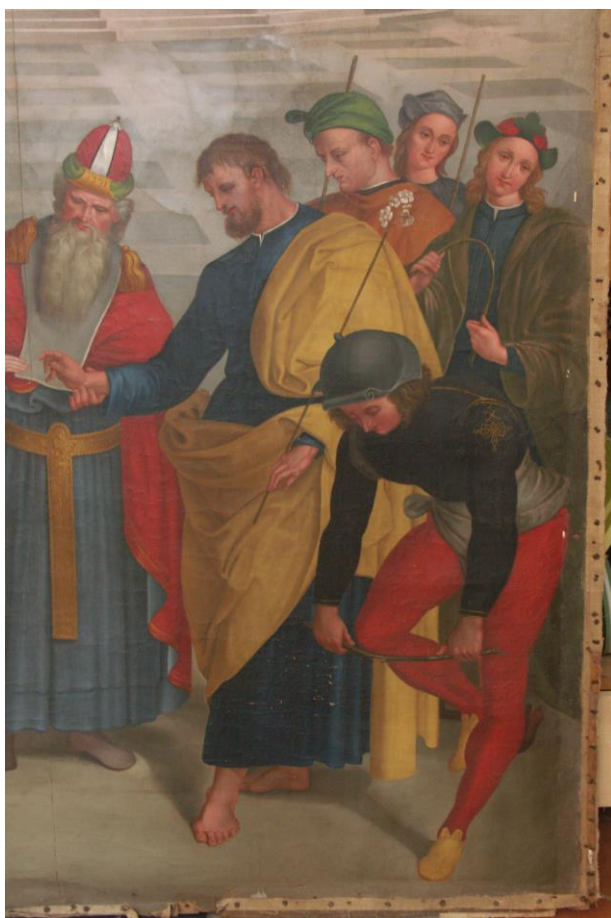
St Joseph et les

Diplômée de la Sorbonne, Maîtrise de Sciences et Techniques de Conservation-Restauration des Biens Culturels