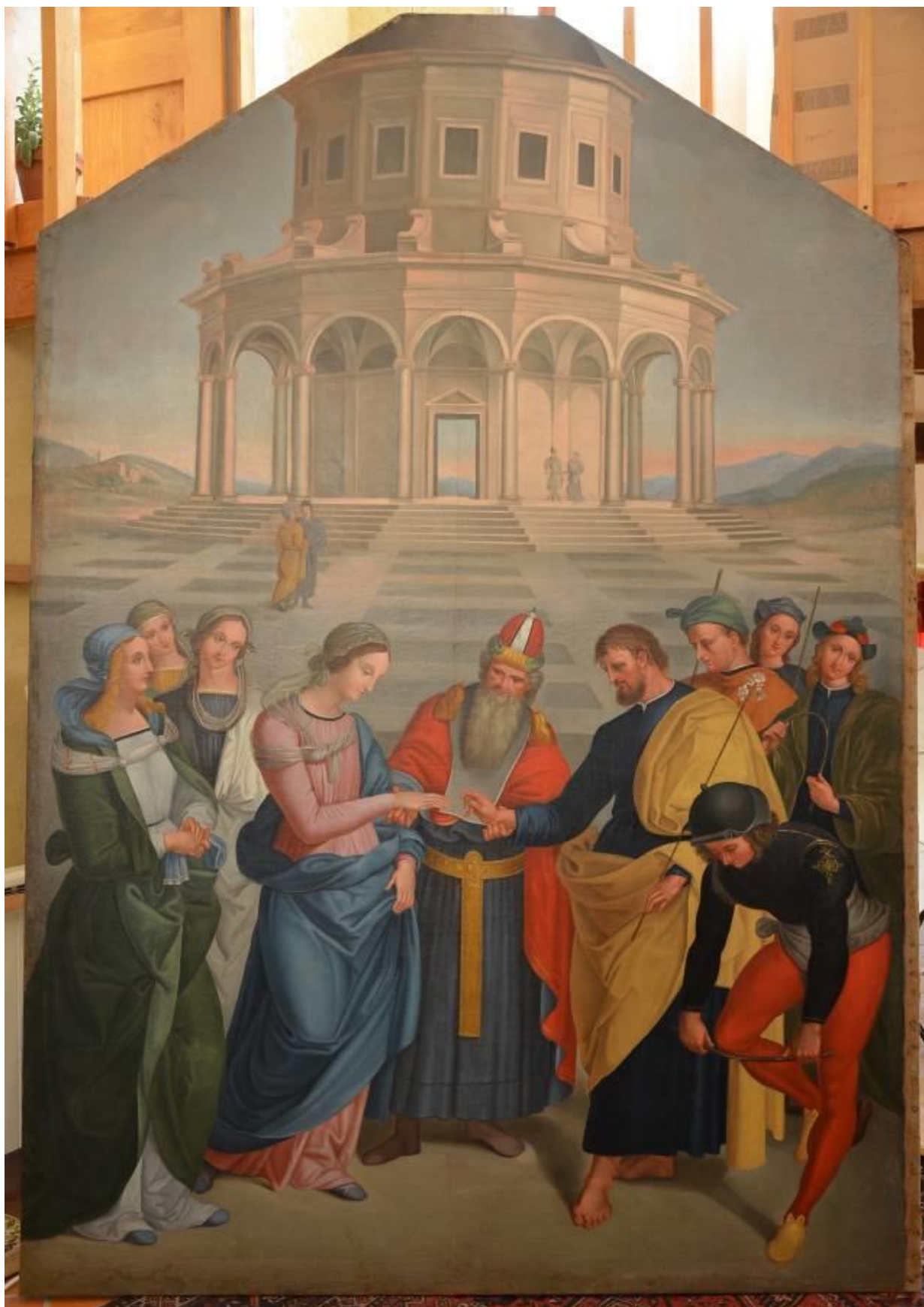
Vue d'ensemble après traitement (nettoyage, refixage, changement du support, réintégration des pertes)

Diplômée de la Sorbonne, Maîtrise de Sciences et Techniques de Conservation-Restauration des Biens Culturels