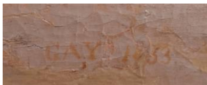
mastics GAY 1833