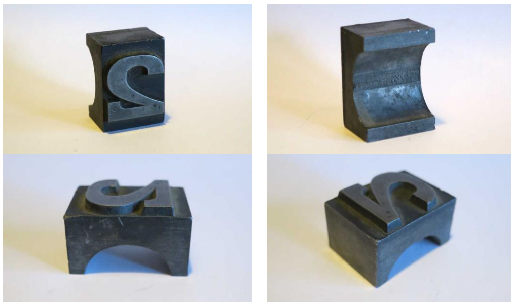
Lettre à pont