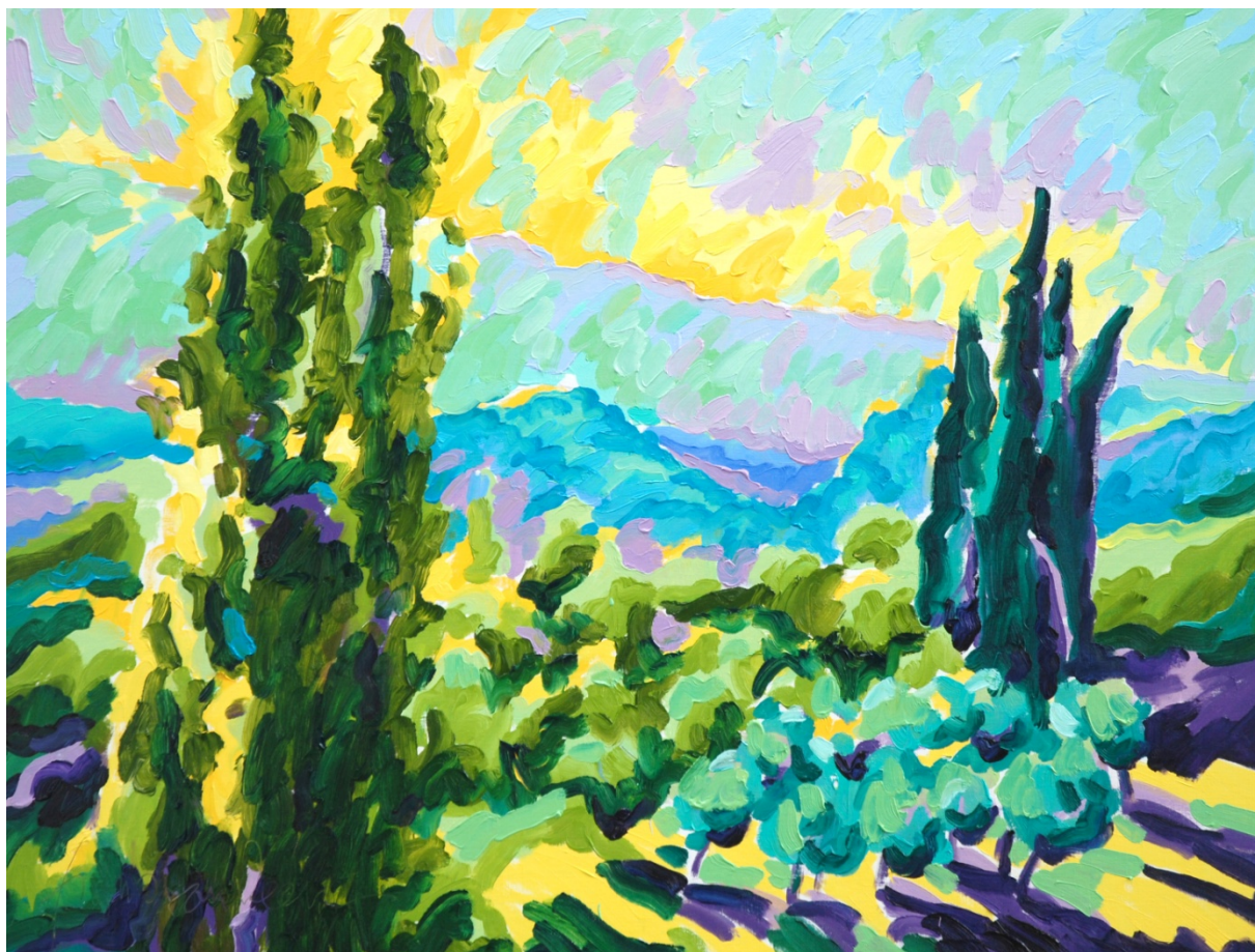
St Hilaire Revisited